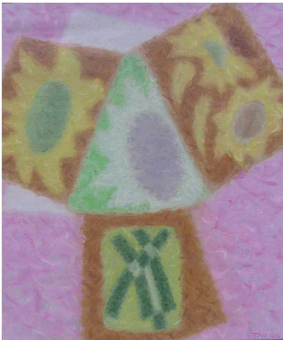
Mihai Țăruș, Floarea-soarelui , u/p, 550×450 mm, 2009

Monografia Populația Basarabiei interbelice. Aspecte demografice , semnată de profesorul Nicolae Enciu, dedicată aspectelor demografice ale evoluției populației basarabene în perioada interbelică, este de o incontestabilă valoare, iar cartea propriuzisă urmează să-și găsească locul pe rafturile bibliotecilor școlare, studențești și de specialitate. De menționat faptul că această cercetare face parte dintr-o lucrare mai largă, dedicată Tradiționalismului și modernității în Basarabia anilor 1918-1940 .